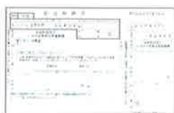
払込用紙 (ゆうちょ銀行・福岡銀行)