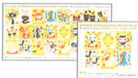
お申込みの複十字シール等